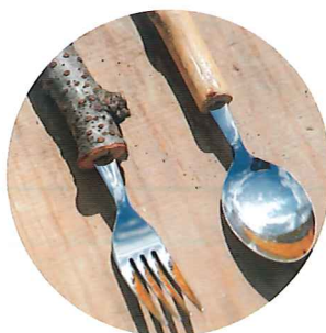
小枝で作ろう! スプーン&フォーク