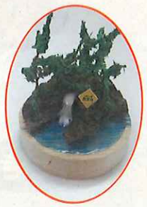
水源の森ジオラマづくり