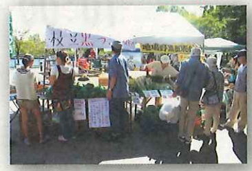
新鮮野菜の販売も!