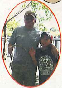
つるかご編みもあるよ (有料)