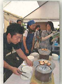
原木しいたけの炭火焼 試食