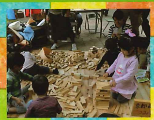
木とふれあう! 木育コーナー