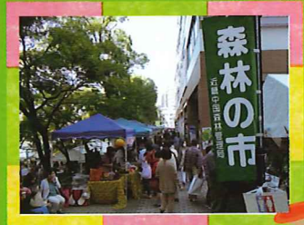
ご来場をお待ちしています♪