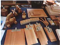
木製品の展示販売