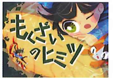
『もくざいのヒミツ』

近畿中国森林管理局の職員が、企画から描画までのすべてを行った「創作紙芝居」『雨水のほうけん』、『もくざいのヒミツ』の2本立てで読み聞かせを行います。