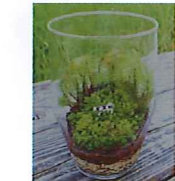
苔(こけ) テラリウムづくり