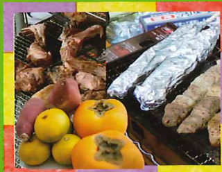
森林のごちそう フードコーナー