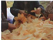
カンナくずで花づくり