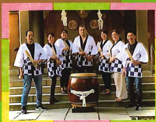
オープニング(9:40頃～)の祝太鼓演奏 八十島太鼓(生國魂神社 社中)