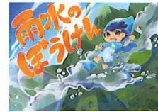
創作紙芝居『雨水のほうけん』