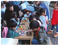
自然素材のクラフトコーナー