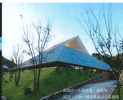
直島ホール所有者：直島町 設計：三分一博志建築設計事務所