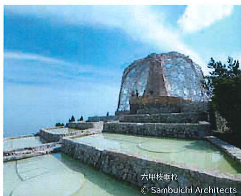
六甲枝垂れ © Sambuichi Architects

大阪市阿倍野区阿倍野筋 1-1-43 【最寄駅】大阪メトロ・JR「天王寺」駅/近鉄南大阪線「大阪阿部野橋」駅