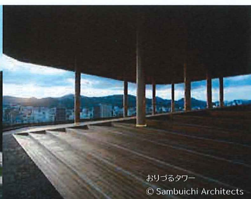
おりづるタワー © Sambuichi Architects