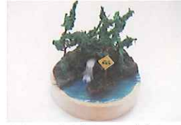
水源の森ジオラマづくり