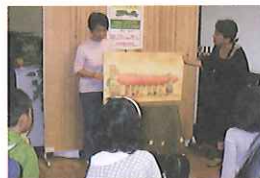
大型絵本の読み聞かせ