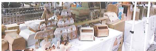
木のおもちゃ、イス、まな板、アクセサリなど木製品の販売