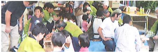
親子木工教室(小学生、イス作り)