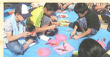
木と遊ぶキッズコーナー

主催:水都おおさか森林づくり・木づかい実行委員会 協賛:一般財団法人日本森林林業振興会大阪支部/一般社団法人全国燃料協会 後援:国土交通省近畿地方整備局/近畿地方環境事務所/近畿農政局/三重県/滋賀県/京都府/奈良県/和歌山県/大阪市/大阪府教育委員会/滋賀県森林組合連合会/京都府森林組合連合会/奈良県森林組合連合会/兵庫県森林組合連合会/和歌山県森林組合連合会/滋賀県木材協会/一般社団法人京都府木材組合連合会/奈良県木材協同組合連合会/兵庫県木材業協同組合連合会/和歌山県木材協同組合連合会/内閣府公益社団法人大阪府猿友会/公益社団法人国土緑化推進機構/公益財団法人関西・大阪21世紀協会/公益財団法人国際花と緑の博覧会記念協会/帝国ホテル 大阪/産経新聞大阪本社/森林環境の保全・整備連絡調整会議