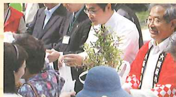
苗木プレゼント (数量限定、スタンプラリー制)