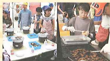
森の食材を活かしたフードコーナー