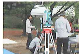
測量体験とパステル画