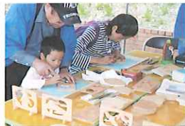
ミニ欄間彫り体験(有料)