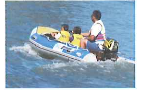
キッズボート乗船体験 当日受付 一人1回200円