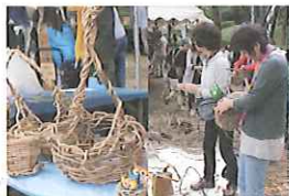
つるかご編み(有料)