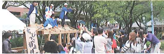
ちびっこ棟上体験