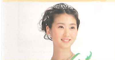
初代「ミス日本 みどりの女神」来場