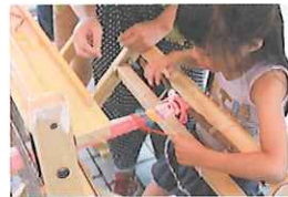
木製織り機でさをり織り(有料)