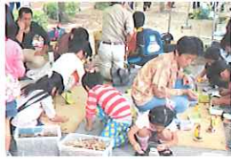
自然素材のクラフト