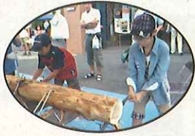
丸太切りにチャレンジ みんなでできこり体験!