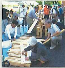
端材のプレゼントはいつも大人気!