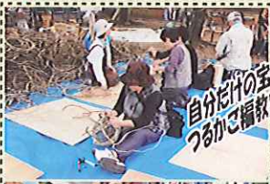
自分だけの宝物を作ろう つるがこ福教室(有料)