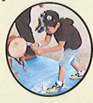
丸太切りに挑戦(無料) 端材のプレゼントもあるよ