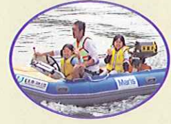
エンジンつきゴムボート キッズボートに乗ってみよう (一人200円)