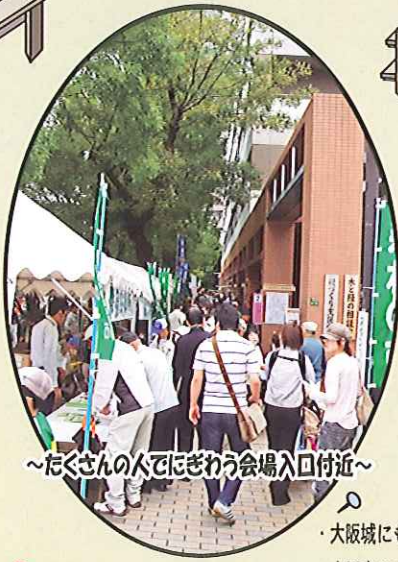
～たくさんの方でにぎわう会場入口付近～