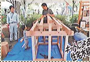
キットによる 住宅木組み体験