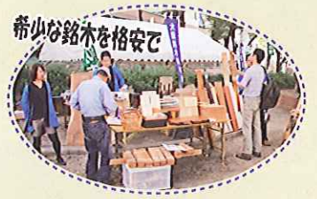
希少な銘木を格安で