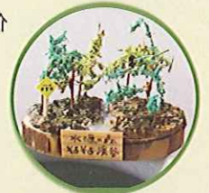
水源の森ジオラマづくり(無料)

お問合せ先: 水都おおさか森林づくり・木づかい実行委員会 事務局 〒530-0042 大阪市北区天満橋 1-8-75(近畿中国森林管理局 技術普及課内) TEL 06-6881-3484 FAX 06-6881-2055 URL: http://www.rinya.maff.go.jp/kinki/ E-Mail: kc_shidou@rinya.maff.go.jp イベント当日の連絡はこちらまで 090-8937-7937