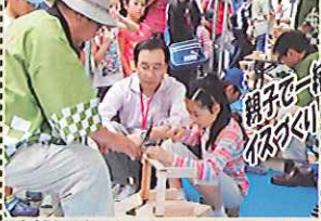
親子と一緒に つくろう(先着順・無料)