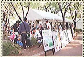
各テントでは体験がぎっしり!