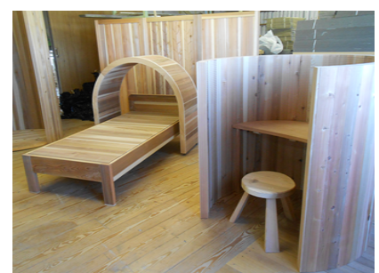
杉木ロスリット材製品